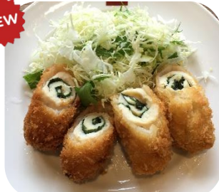
青シソササミフライ ¥370