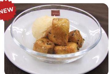
ミニ大学芋アイス乗せ ¥300