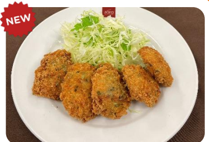
磯が香るタラの一口フライ ¥400