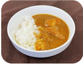
ミニミニカレー ¥250 (サラ中辛・甘ロ・キーマ)