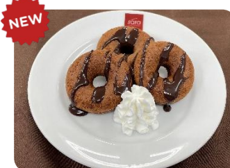
焼きチョコドーナツ ¥280