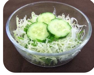
ミニサラダ ¥150 お好きなドレッシングをかけて お召し上がりください。