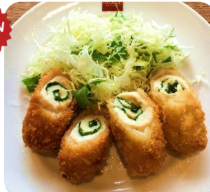
青シソササミチーズフライ ¥400