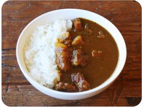
ミニミニカレー ¥180 (サラ中辛・甘口・キーマ)