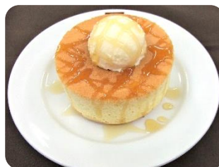
厚焼きホットケーキアイス乗せ ¥350