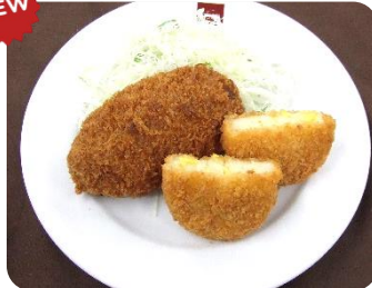
メンチカツ・コーンコロケ ¥370