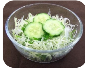
ミニサラダ ¥120 お好きなドレッシングをかけて お召し上がりください。