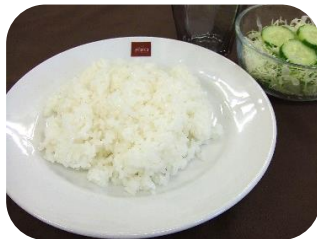
ライスセット ¥390 (ライス・サラダ・スープ・ドリンクバー付き)